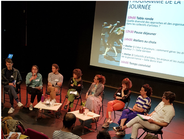
Table ronde • QUELLE DIVERSITÉ D'APPROCHES ET D'ORGANISATIONS DANS LES COLLECTIFS D'ARTISTES ?