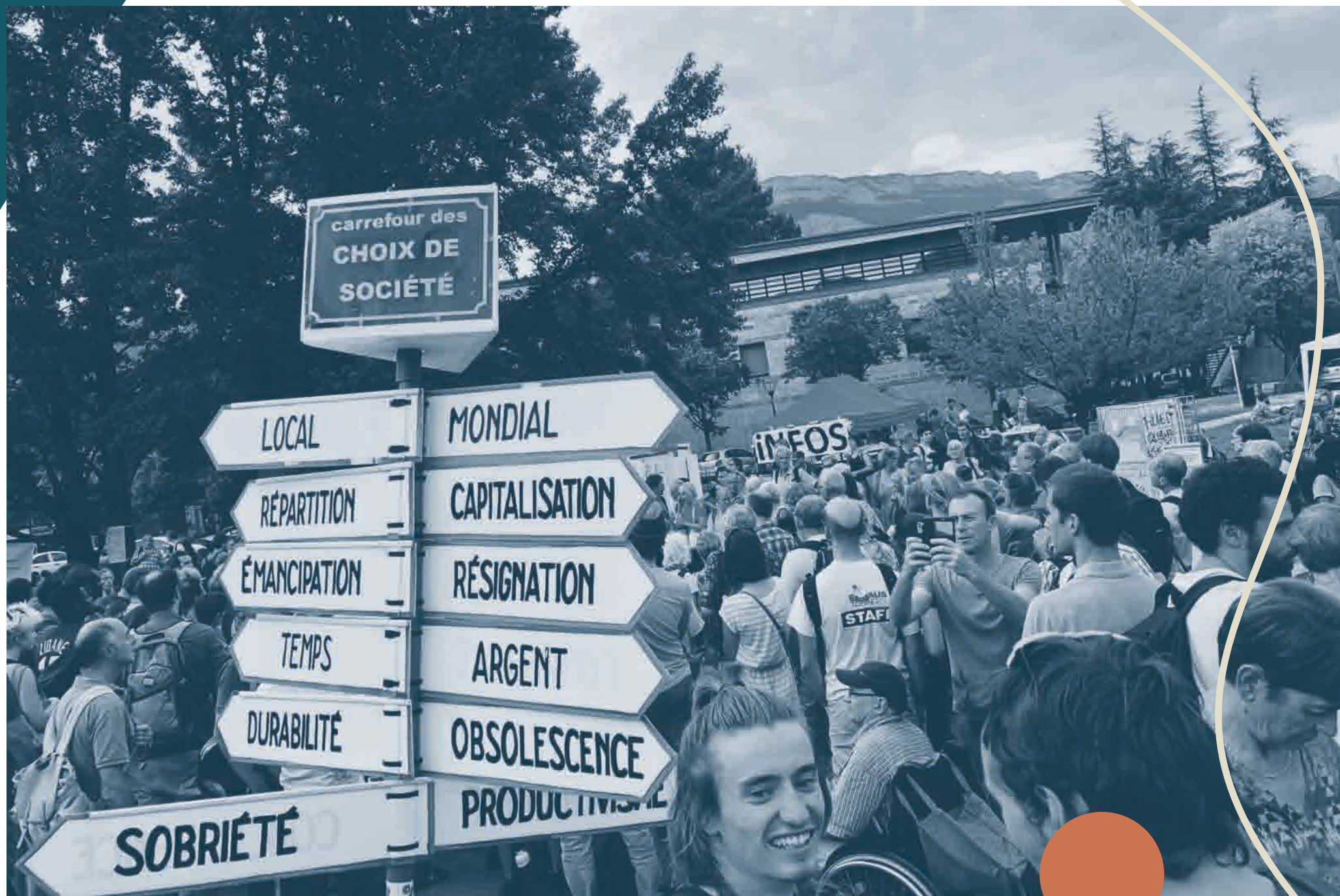
Université d'été solidaire et rebelle des mouvements sociaux et citoyens, Grenoble, 2018.