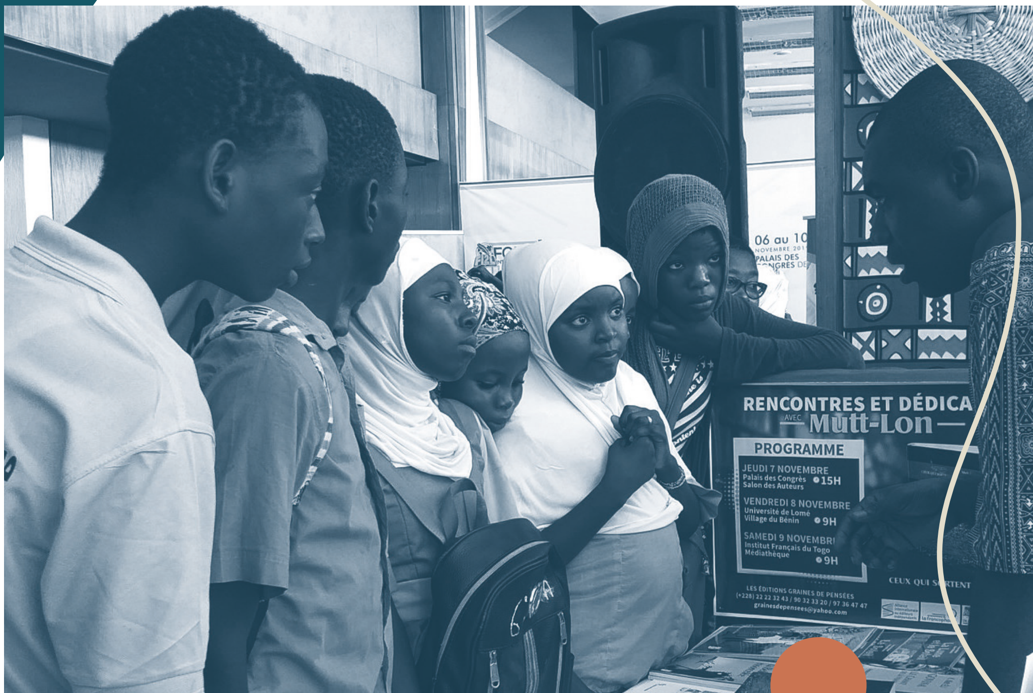
Tournée de Mutt-Lon, auteur de Ceux qui sortent dans la nuit , dans 4 pays d'Afrique francophone. Projet de co-édition solidaire, AIEI, 2019.