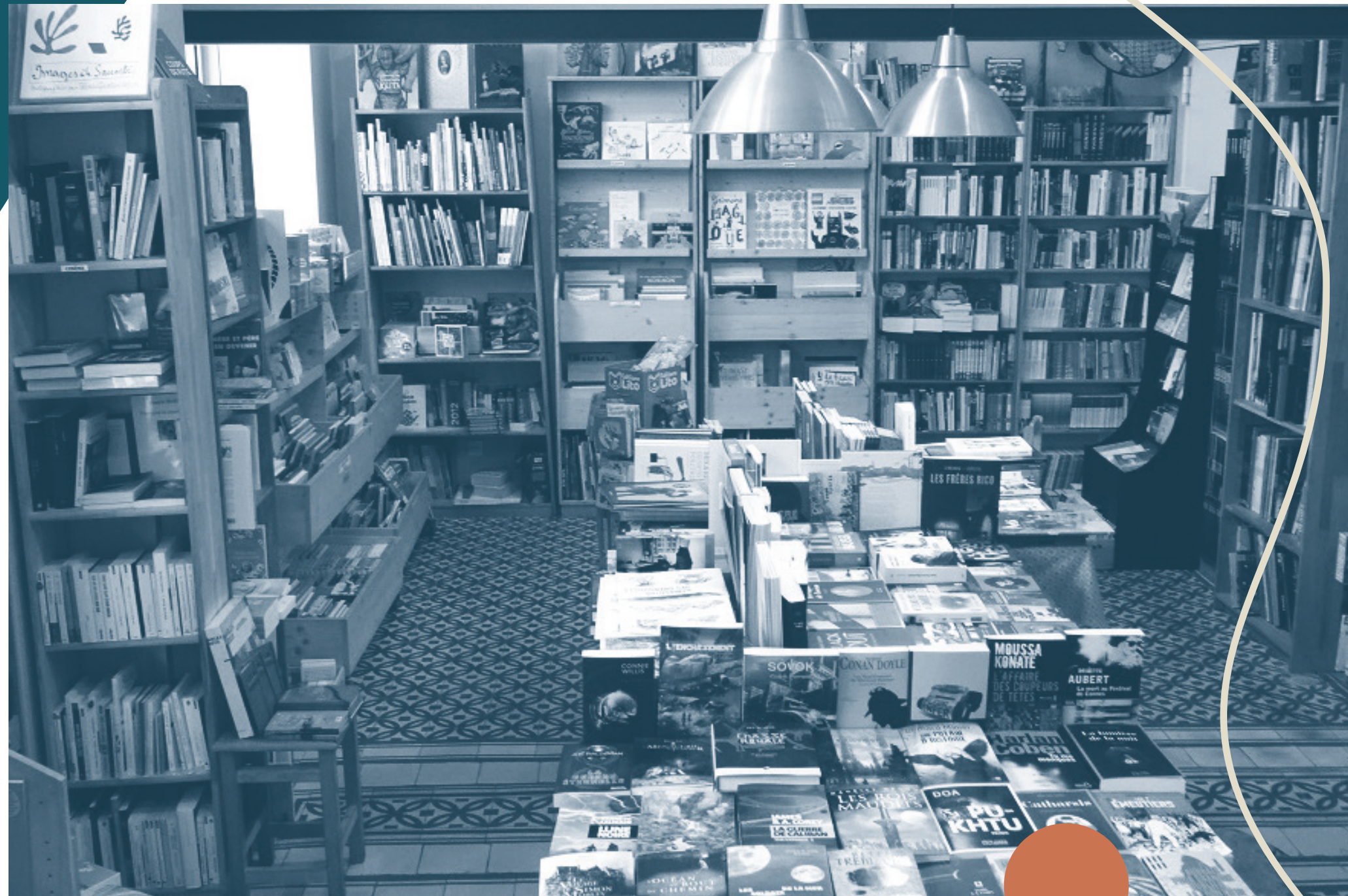
Librairie indépendante et engagée, Le Rideau Rouge, 75018.