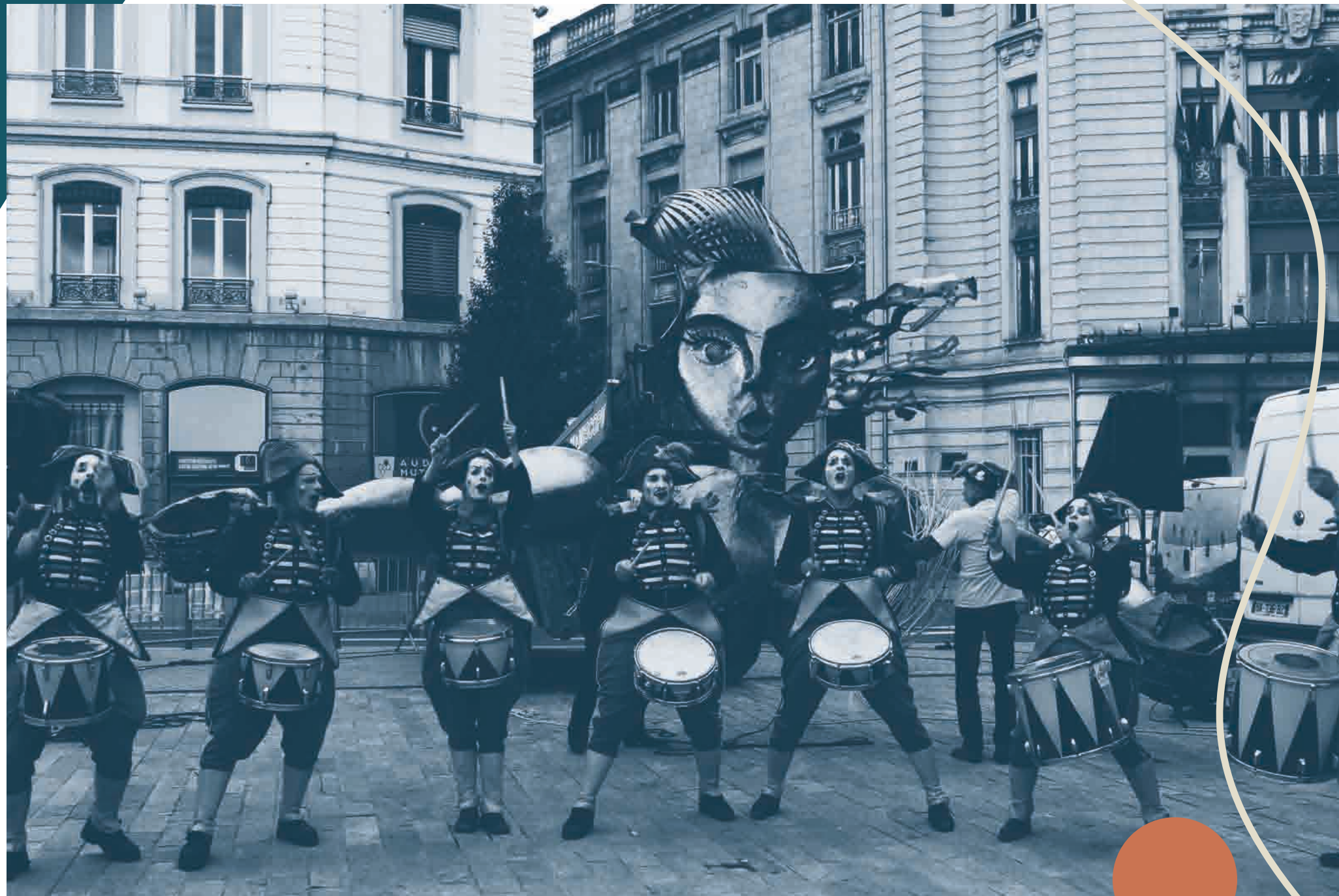
Rue Libre 2016, Lyon.