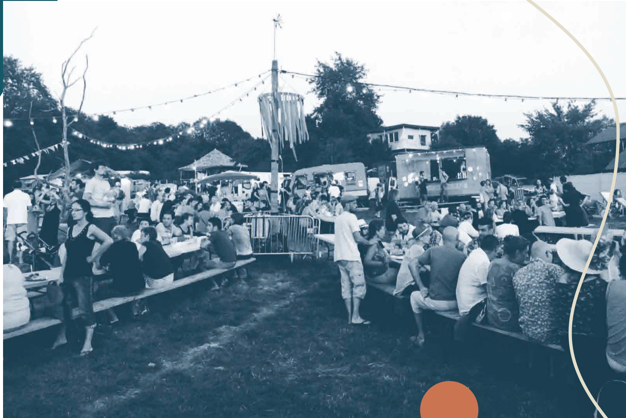
Festival L'été de Vaour 2019, Tarn.