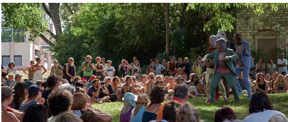
Arts de la rue

Le lieu accueillant est un entrepreneur exploitant de spectacles vivants. Les jauges sont très variables, allant du micro-lieu aux salles/sites accueillant plusieurs milliers de spectateurs. Petit lieu de proximité au public local ou salle mythique à la renommée internationale accueillant des touristes du monde entier, tous proposent des espaces de bar ou de restauration gérés en interne ou confiés en prestation.