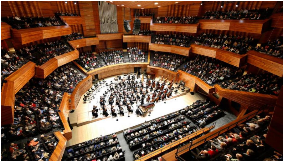
Auditorium de la Maison de la Radio et de la Musique - Architecte : AS Architecture Studio. Photo : G.F. Beraeret