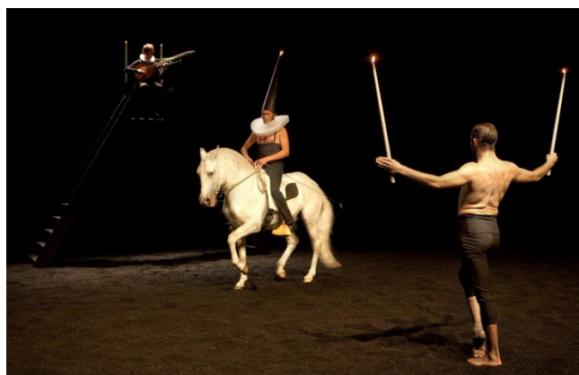
On achève bien les anges (élégie) Théâtre équestre Zingaro 2016