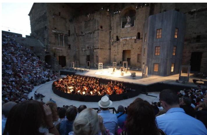
Chorégraphie d'Orange

Que les entreprises relèvent du secteur public (subventionné) ou privé, leurs objectifs ne sont pas consuméristes ni productivistes. A ce titre, les activités du spectacle vivant sont essentielles à la Nation et elles bénéficient du soutien des pouvoirs publics et d'une réglementation protectrice. Cette exception culturelle induit des caractéristiques socio-économiques qui structurent le marché du travail différemment des autres secteurs.