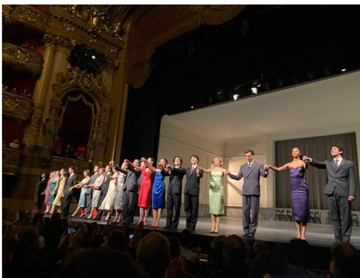
« Kontaktthof », un ballet de Pina Bausch Opéra du Paris - 2022

Ainsi, très peu d'entreprises ont la capacité de mener de la GPEC à moyen et longs termes (gestion prévisionnelle des emplois et des compétences).