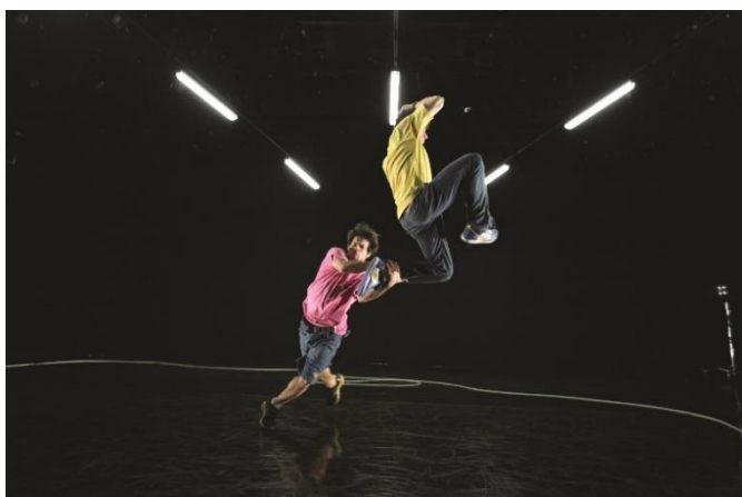
H3 L'Apostrophe scène nationale @ Bruno Beltrao

Le spectacle vivant : un secteur composite, dynamique et innovant