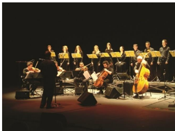
Dibbouk L'Apostrophe scène nationale